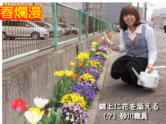
錦上に花を添える(?) 砂川職員