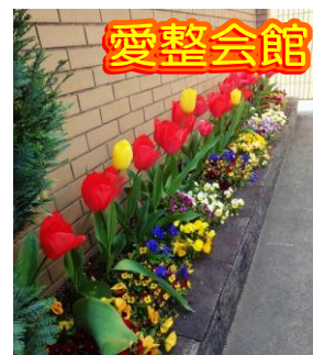
女性職員の手入れにより、会館玄関脇と西側駐車場に春の花が見事に咲いた。